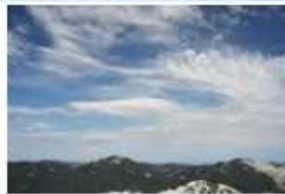
Cirrus (Ci), Cirrocumulus (Cc), Cirrus fibratus (Ci fib) Altocumulus (Ac)