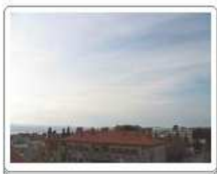
Cirrostratus fibratus (Cs fib)