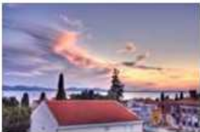
Cirrus spissatus uncinus (Ci spi unc), Altocumulus floccus (Ac flo)