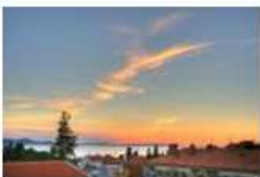
Cirrus fibratus (Ci fib), Cirrus floccus (Ci flo)