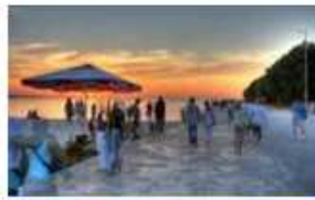
Cirrus spissatus (Ci spi)