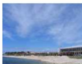
Cirrus spissatus (Ci spi)