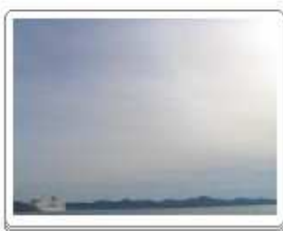
Cirrostratus nebulosus (Cs neb)