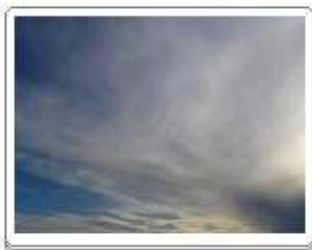
Cirrostratus fibratus undulatus (Cs fib un)