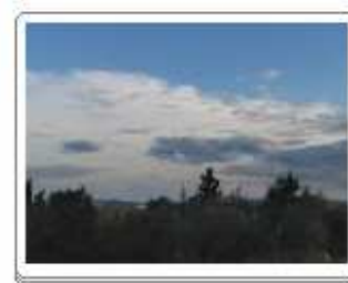
Cirrostratus (Cs), Alto cumulus floccus (Ac flo), Alto cumulus opacus (Ac op)