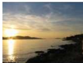
Cirrus intortus (Ci in)