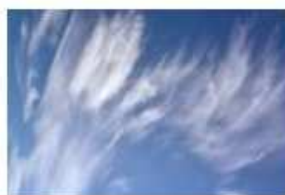
Cirrus fibratus (Ci fib)