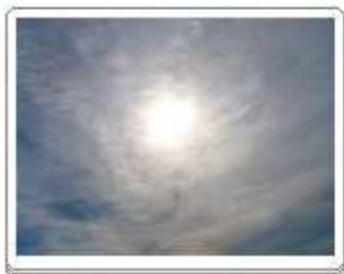
Cirrostratus fibratus (Cs fib)