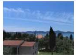
Cirrus uncinus (Ci unc)