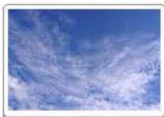
Cirrocumulus stratiformis (Cu str)