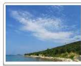
Cirrocumulus floccus (Cc flo)