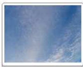
Cirrocumulus stratiformis (Cc str)