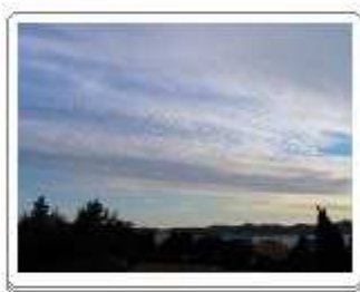
Cirrocumulus undulatus (Cc un)