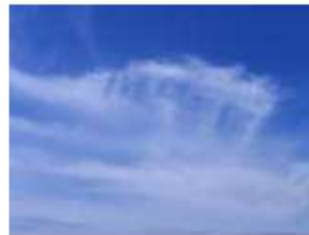
Cirrus spissatus (Ci spi)