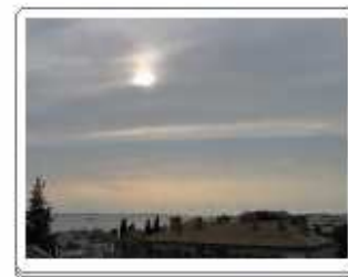
Cirrostratus nebulosus (Cs neb)