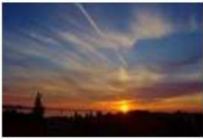
Cirrus fibratus (Ci fib), kondenzacijski trag

Od vrsta, Ci može biti fibratus (fib), uncinus (unc), spissatus (spi), castellanus (cas), floccus (flo). Od podvrsta, cirrus može biti intortus (in), vertebratus (ve), radiatus (ra), duplicatus (du). Od dodatnih obilježja, može poprimiti oblik mamma (mam).