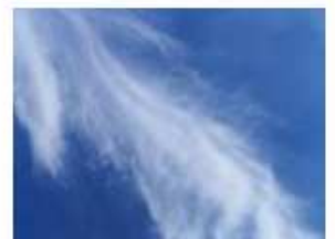
Cirrus fibratus (Ci fib)