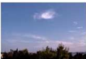
Cirrus floccus (Ci flo)