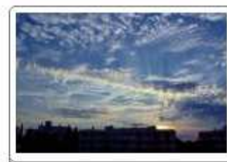
Cirrocumulus (Cc), Altocumulus (Ac), sunčeve zrake (sun rays, crepuscular rays)